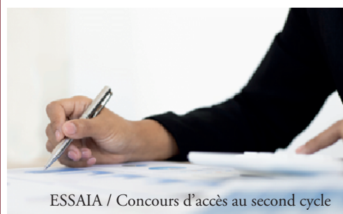
ESSAIA / Concours d'accès au second cycle

À l'École Supérieure des Sciences de l'Aliment et des Industries Agroalimentaires d'Alger (ESSAIA), l'accès au deuxième cycle représente une étape décisive dans le parcours académique de l'étudiant.